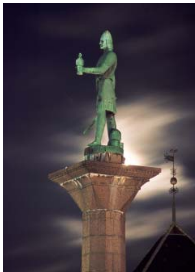
Trondheim er full av historie – på Torvet troner Olav Trygvason, byens grunnlegger.