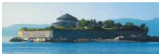
Munkholmen har mye å fortelle.

Under gruppearbeidet vil det for første gang bli en egen sesjon for skoleløsningen. De fleste skolebibliotekene er små, men de er mange. Det skal