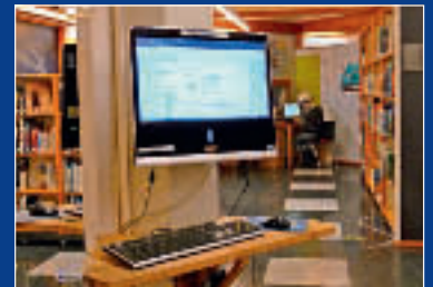
Publikumsmaskiner med pålogging og karantenetid, s. 6